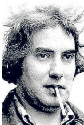
Rolf Dieter Brinkmann (1940-1975).